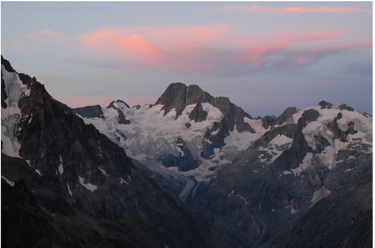
Les Bans (in centro), Mont Giobernay (a destra)