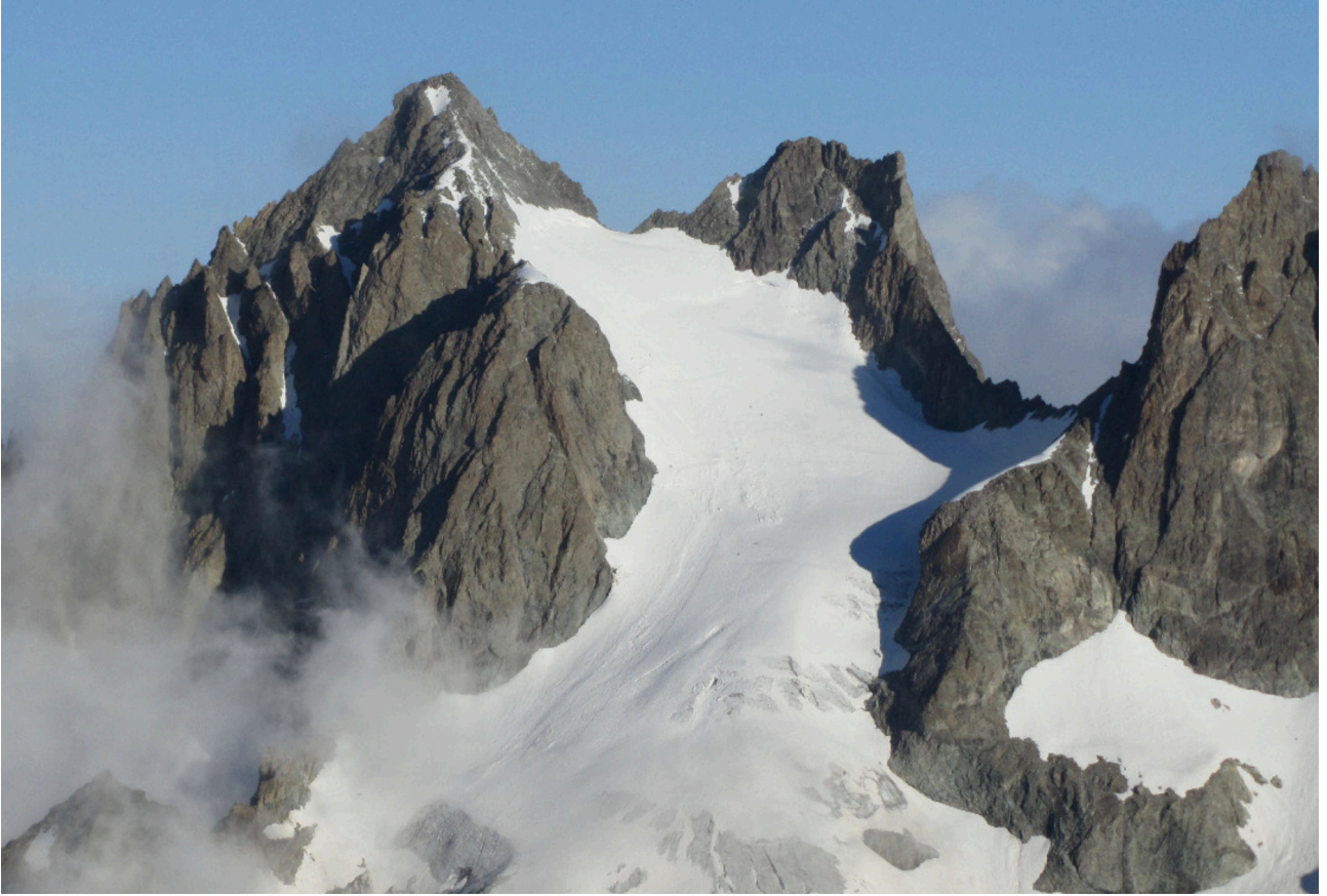
Pic Maitre, in centro