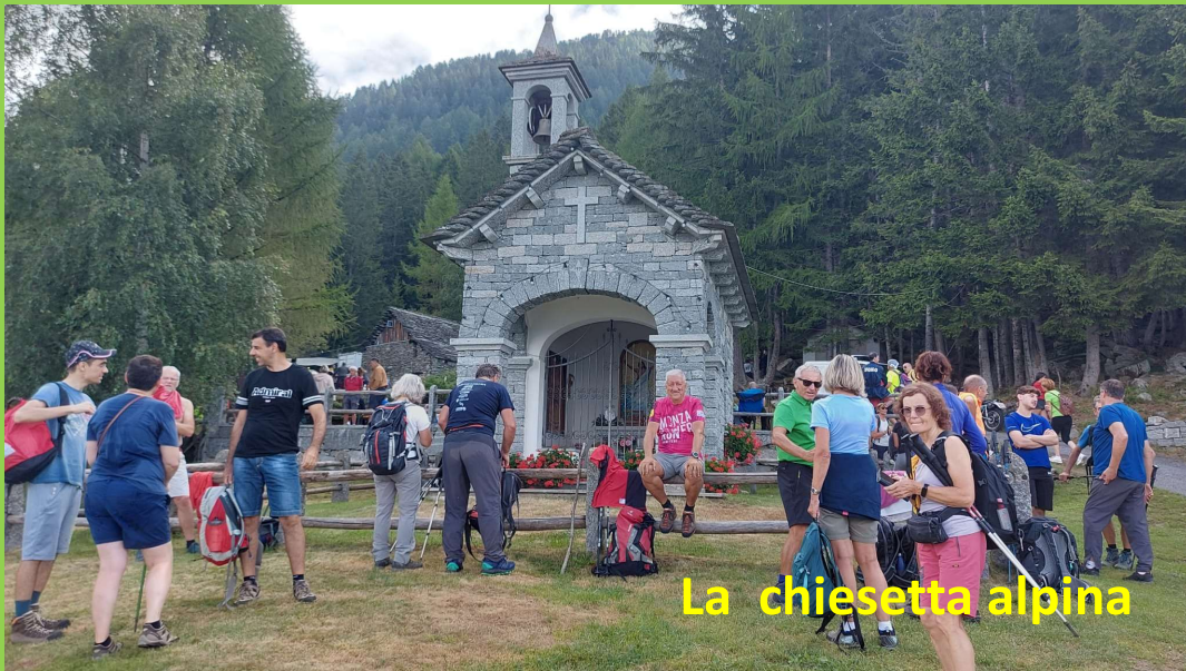
La chiesetta alpina