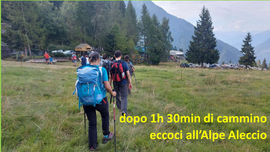
dopo 1h 30min di cammino eccoci all'Alpe Aleccio