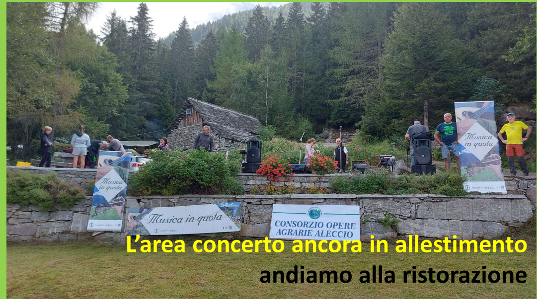
L'area concerto ancora in allestimento andiamo alla ristorazione