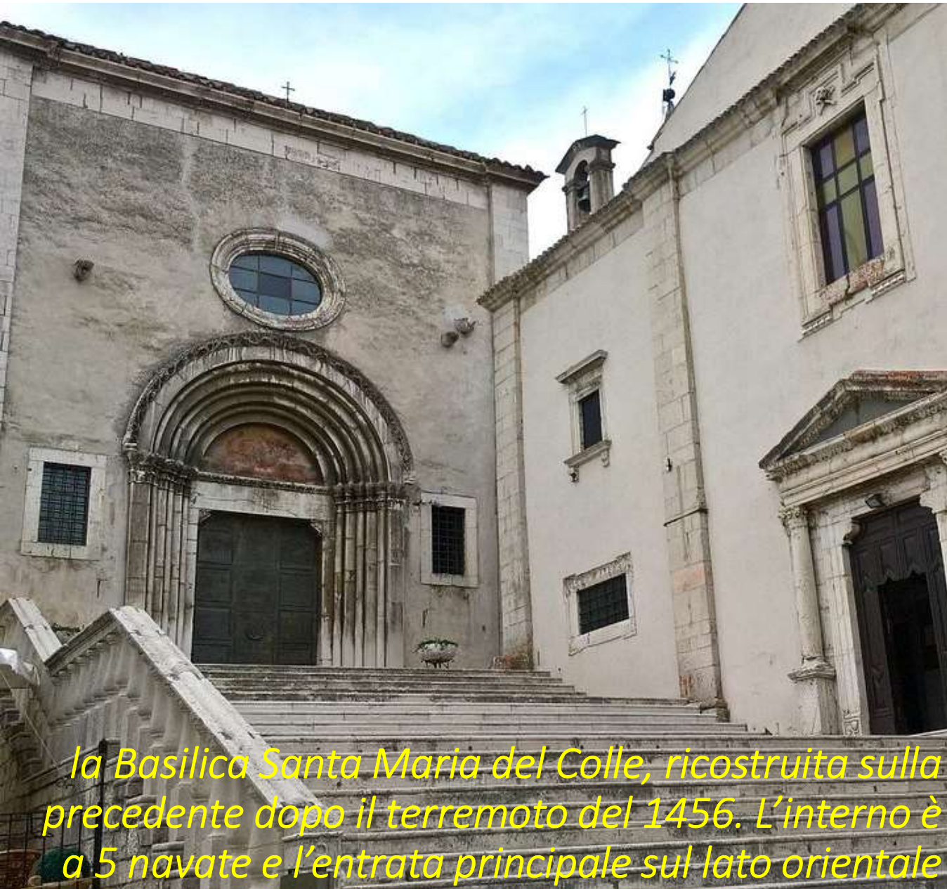
la Basilica Santa Maria del Colle, ricostruita sulla precedente dopo il terremoto del 1456. L'interno è a 5 navate e l'entrata principale sul lato orientale