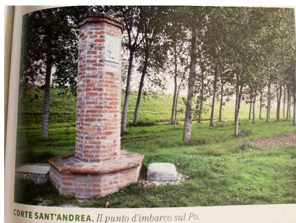
CORTE SANT'ANDREA. Il punto d'imbarco sul Po.

Da Orio Litta a Piacenza Km.22 (25 KM.) (Cod.280)