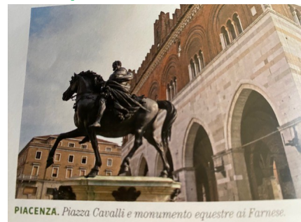
PIACENZA. Piazza Cavalli e monumento equestre ai Farnese.