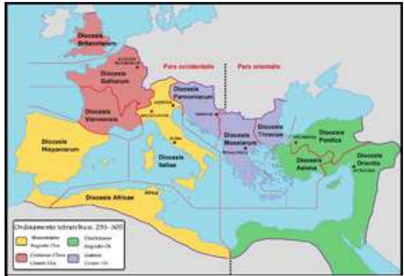
La Tetrarchia di Diocleziano : Impero diviso in quattro grandi aree di governo

Milano nel terzo secolo era una città di 25000 abitanti dove aveva sede l'imperatore Massimiano che governava su: Gallie, metà della Germania, Spagna, Portogallo, il nord Africa mi sembra sino a Tebe in Egitto. Mediolanum si poteva dunque anche accontentare! ( curiosità: Pensate che tutti i primi martiri che portarono il Cristianesimo dalle 'nostre' parti erano di origine africana berbera o palestinese; Agostino, Barnaba, Vittore, Nabore, Felice, Alessandro... )